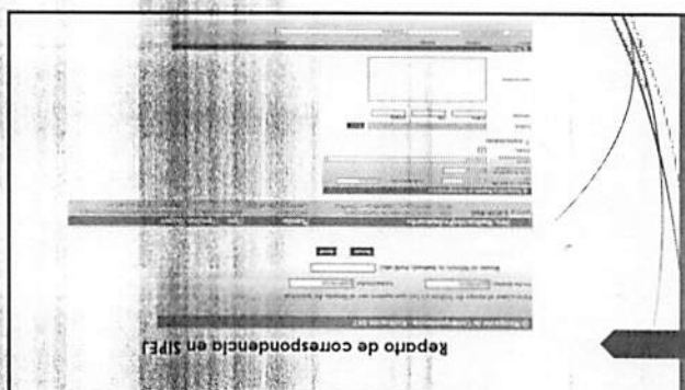
Reparto de correspondencia en SIFEJ