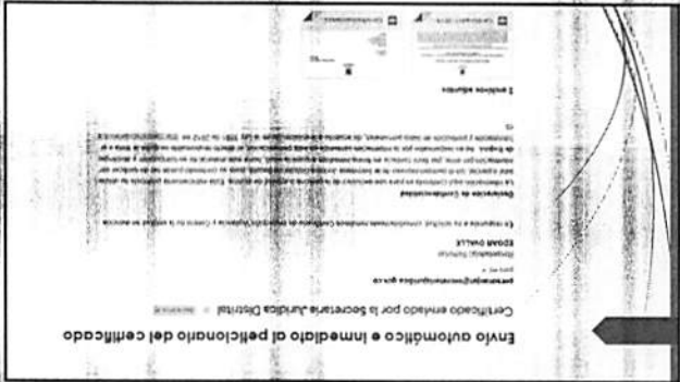
Envío automático e inmediato al peticionario del certificado