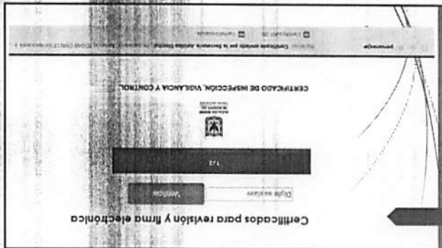
Certificados para revisión y firma electrónica