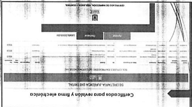
Certificados para revisión y firma electrónica