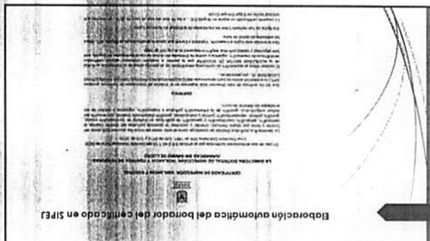
Elaboración automática del borrador del certificado en SIFEJ