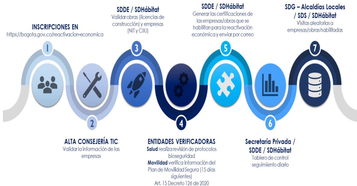
Flujograma reactivación de empresas y obras de construcción

Como se describe en el gráfico anterior, todas las empresas de los sectores de la economía exceptuados de las medidas de aislamiento por el Gobierno Nacional deberán adoptar los protocolos de bioseguridad establecidos por el Ministerio de Salud y Protección Social y la Secretaría Distrital de Salud y registrarlos en el aplicativo www.bogota.gov.co/reactivacion-economica . Una vez se registran, la Alta Consejería para las TIC, hace una revisión de la validez y la completitud de los registros. Posteriormente, en el paso 3, la Secretaría de Desarrollo Económico (SDDE) valida el NIT y CIU de las empresas para verificar que la